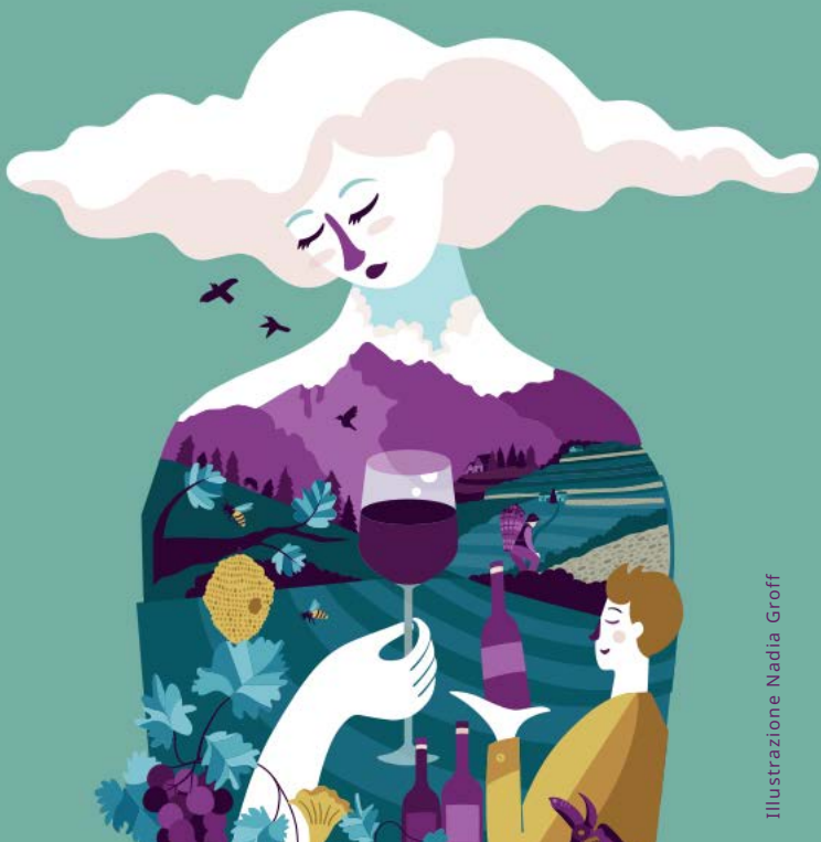
Illustrazione Nadia Groff