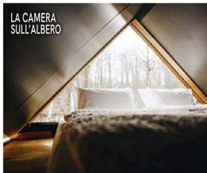
LA CAMERA SULL'ALBERO