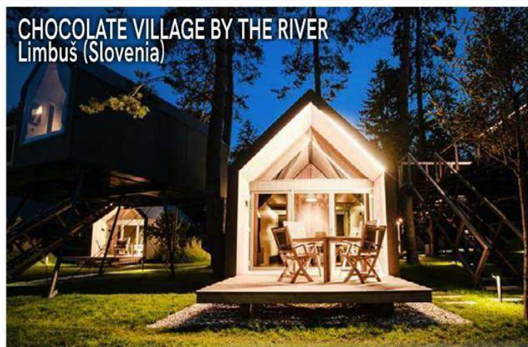
CHOCOLATE VILLAGE BY THE RIVER Limbuš (Slovenia)

La meta: a 5 km da Maribor, città "chicca" sulle sponde del fiume Drava, e vicino alla funivia di Pohorje, la più grande stazione sciistica slovena. Info: www.slovenia.info