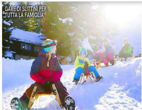
GARE DI SLITTINI PER TUTTA LA FAMIGLIA