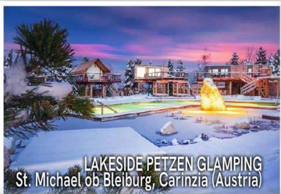
LAKESIDE PETZEN GLAMPING St. Michael ob Bleiburg, Carinzia (Austria)