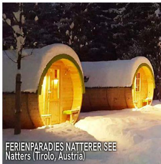
FERIENPARADIES NATTERER SEE Natters (Tirolo, Austria)