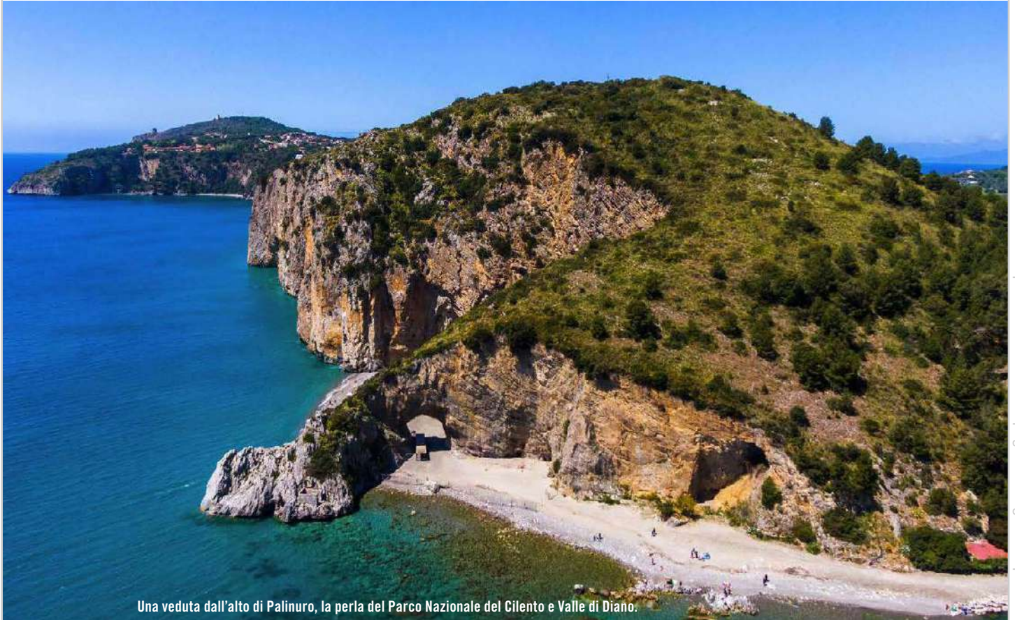
Una veduta dall'alto di Palinuro, la perla del Parco Nazionale del Cilento e Valle di Diano.