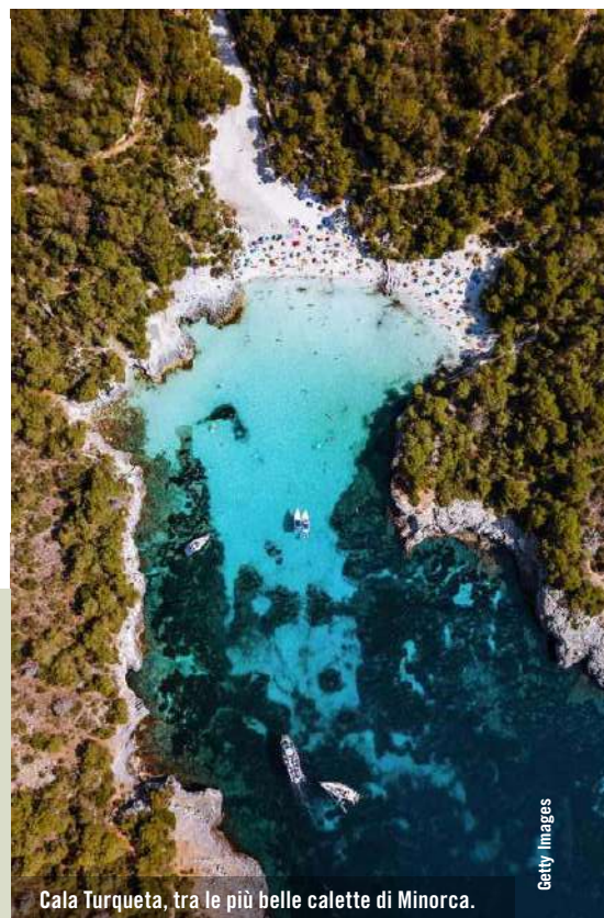
Cala Turqueta, tra le più belle calette di Minorca.