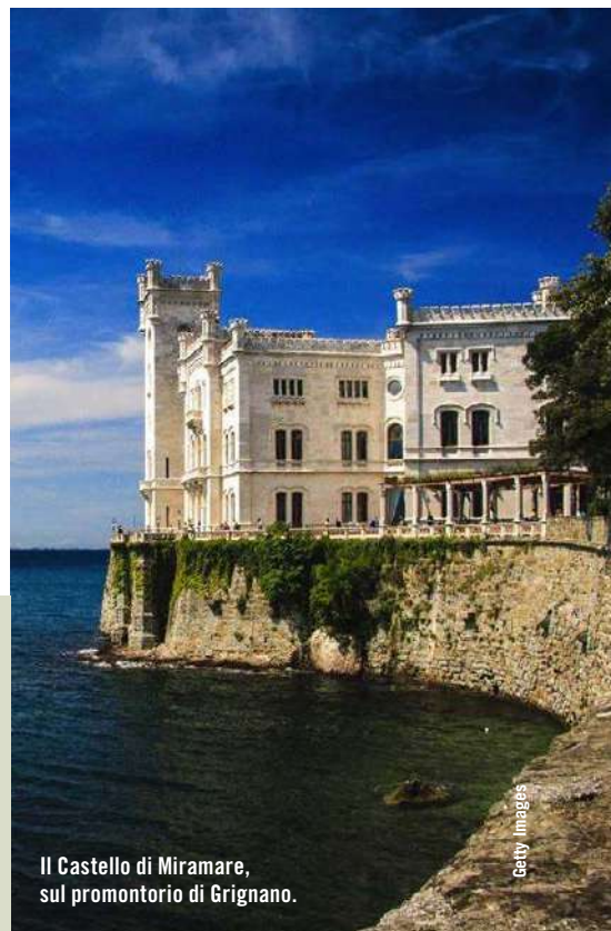
Il Castello di Miramare, sul promontorio di Grignano.