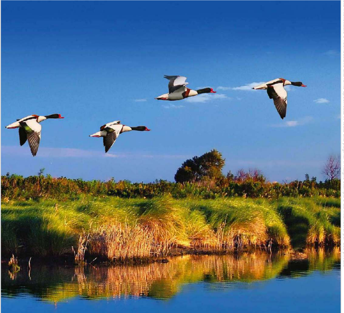
Il volo degli uccelli allo Scano Boa, il più orientale e proteso dentro l'Adriatico. Si tratta di una lingua di sabbia dorata che si raggiunge in barca e custodisce un paesaggio selvaggio. Nelle foto in basso, i confortevoli spazi del Glamping Lodge Tent Suite, gli interni di uno dei Luxury Chalet e gli esterni delle Lodge Tent del Barricata Holiday Village.