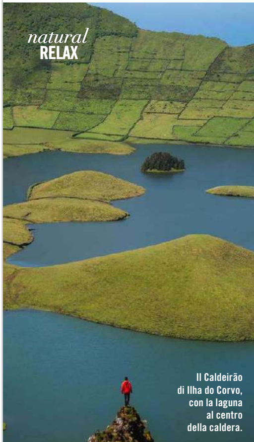
Il Caldeirão di Ilha do Corvo, con la laguna al centro della caldera.