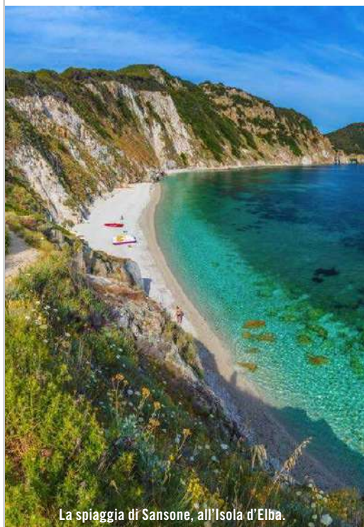
La spiaggia di Sansone, all'Isola d'Elba.