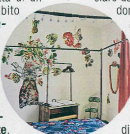
Madama Hostel Milano

P er italiani e stranieri, è una meta sempre più attrattiva . E la città è sempre più attenta alla sostenibilità, anche nell'accoglienza. Un esempio? Nella zona di Porta Romana, l' ostello Madama ( madahostel.com ) ha intrapreso da anni un percorso per la riduzione degli sprechi e l'uso responsabile delle risorse. La struttura si è dotata di un Manifesto nell'ambito del progetto "Madama Goes Green" che sviluppa, in ogni servizio offerto agli ospiti, dalle stanze al bistrot, soluzioni concrete e rispettose dell'ambiente .