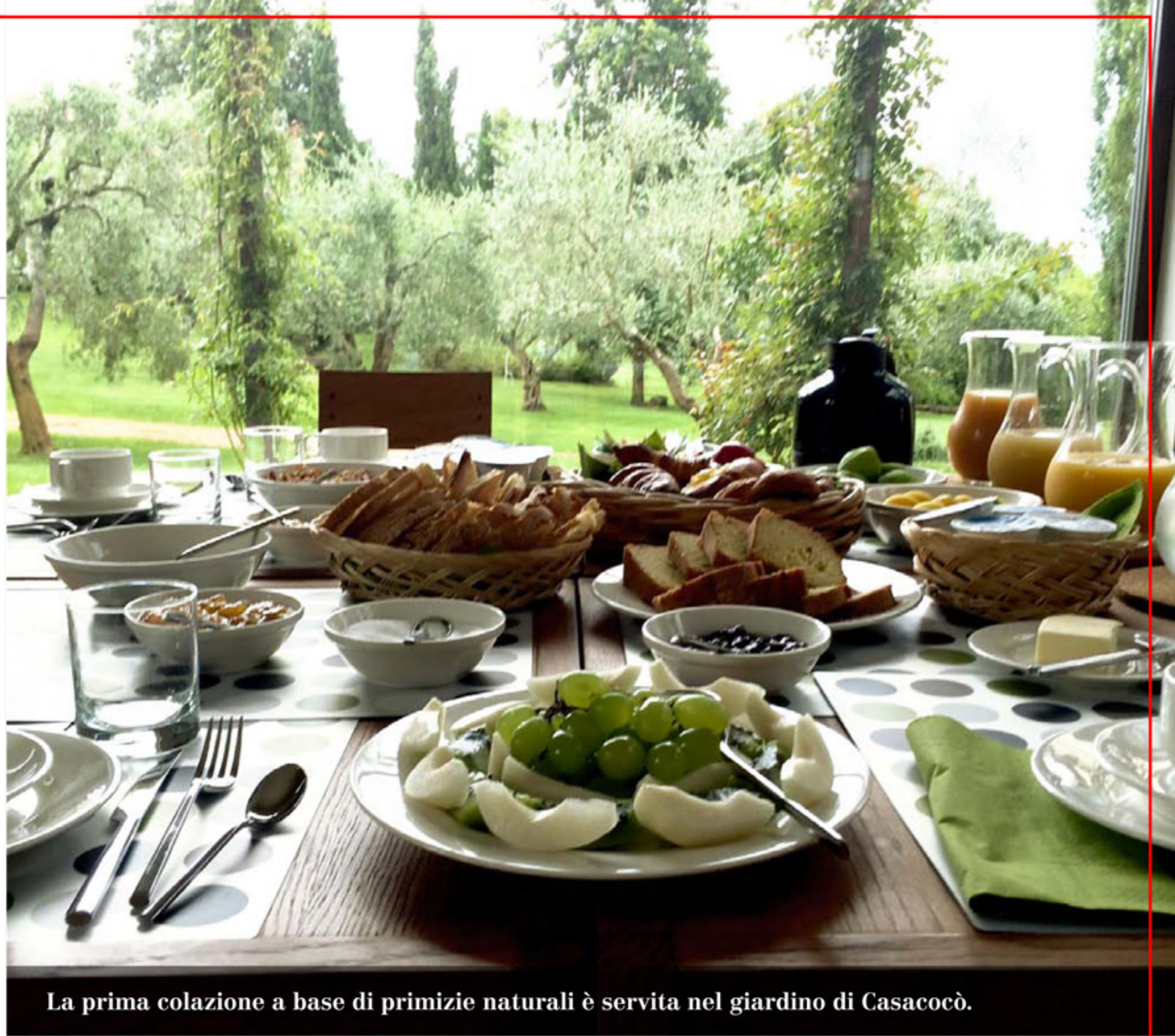
La prima colazione a base di primizie naturali è servita nel giardino di Casacocò.

La Tuscia, nella Maremma Laziale, viene chiamata così perché custodisce un patrimonio fatto di riserve naturali e borghi, molto simile per ricchezza a quello della Toscana. Ma con un pregio in più. Quello di essere ancora un'area poco nota. L'itinerario ideale parte dal lago di Bracciano ( www.consorziolagodibracciano.it ), dove si affaccia il castello Orsini-Odescalchi ( www.odescalchi.it ), nel quale vengono organizzate visite molto particolari, come quella agli appartamenti e al giardino segreto, oppure quella che si conclude con un aperitivo a base di prodotti a chilometro zero in una delle sale affrescate. Non distante, raggiungibili in auto o con una piccola crociera sul lago con la motonave, si trovano anche Trevignano Romano e il borgo medievale di Anguillara Sabazia, famoso per la sorgente di acqua minerale effervescente naturale. Sono un paradiso di acque anche le Terme di Stigliano ( www.termestigliano.it ), che offrono piscine termali e un centro benessere famoso per il Percorso Romano, tra ambienti a diverse temperature. Da qui, percorrendo la Strada Provinciale 3A, bastano dieci minuti per arrivare a Manziana, dove si trova Casacocò,