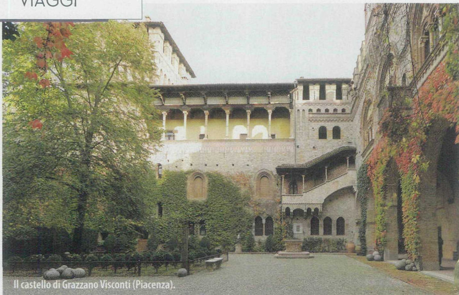
Il castello di Grazzano Visconti (Piacenza).